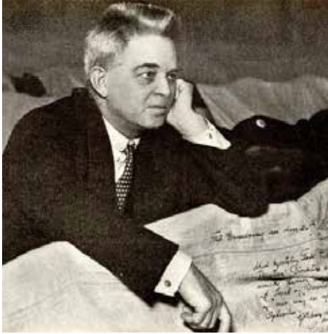
Carl Nielsen en un ensayo de la ópera “Saul y David”, en Gotemburgo (1928)