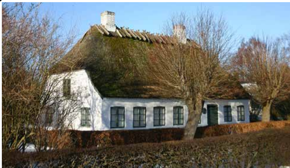
La casa de la infancia de Nielsen, en Sortelung, al sur de la ciudad de Odense.