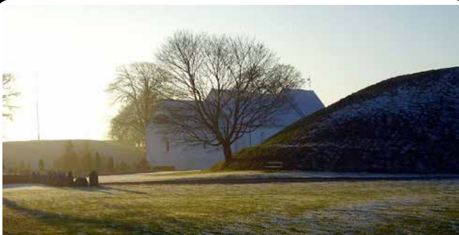
La Iglesia de Jelling, ubicada entre el Túmulo Norte y el Túmulo Sur.