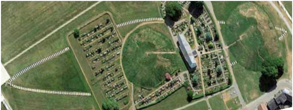
“El Monumento de Jelling” (visto desde el aire)

De este nuevo estudio surgieron los restos de una empalizada muy grande, que cubre un área de 120.000 m 2 . La empalizada rodea al gran barco de piedra, los dos grandes túmulos, la iglesia y las dos piedras rúnicas. El Túmulo Norte, con su cámara funeraria, se encuentra exactamente en el centro del gran recinto rodeado por la empalizada. Se han establecido varias fases de construcción para la empalizada y también se han excavado varias grandes viviendas. Muchos nuevos datos sugieren que una residencia real bien puede haber estado ubicada en Jelling. Las próximas excavaciones tal vez aclaren si la mansión real es la estructura vikinga más antigua del sitio y si el montaje del barco, las cámaras funerarias y las piedras rúnicas son monumentos posteriores, o tal vez deban investigarse otras posibilidades. ☚