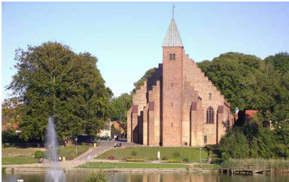
Maribo domkirke, Lolland-Falster Stift (Catedral de Maribo, diócesis de Lolland-Falster)

Det er med til at få os igennem krisen som hele mennesker og en hel kultur, hvor vi holder sammen om det, der er det vigtigste, og hvor vi bevarer håbet om bedre tider - et håb, som er med til at give os fornyet livsmod.